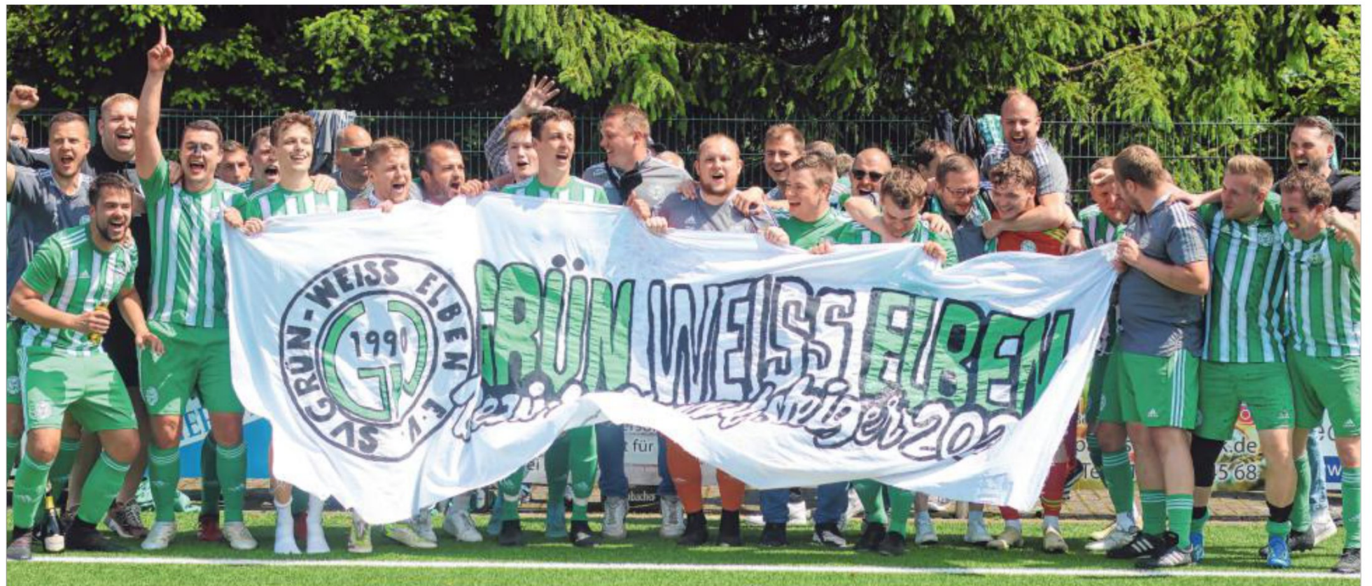
Die Fußballer von Grün-Weiß Elben feiern den Aufstieg in Bezirksliga und tun es den Meisterteams von 2002 und 2016 gleich.

Mit beeindruckender Konstanz ließ die „Rasenbande“ den großen Favorit und mit reichlich höherklassigen Spielern verstärkten SV Heggen hinter sich, gegen den Elben im direkten Vergleich keine Schnitt-